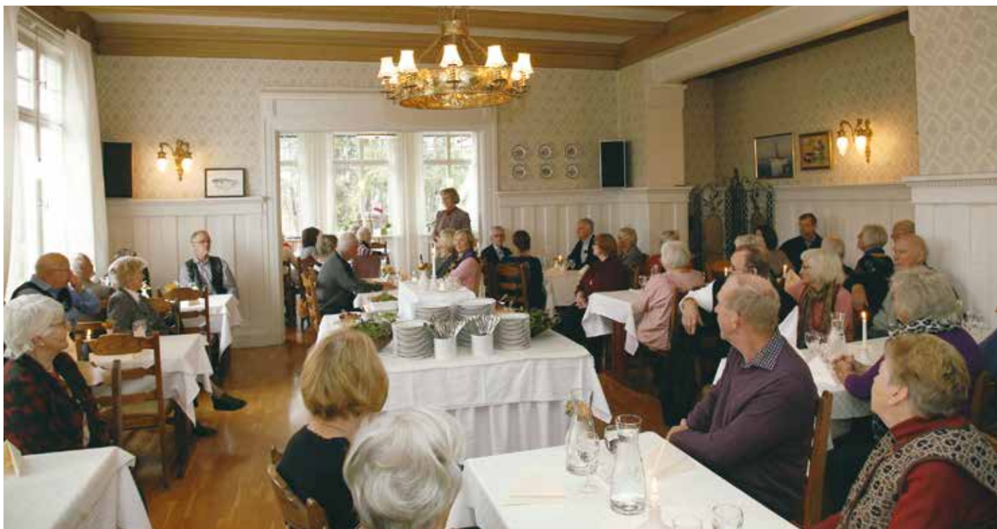
Besökarna fick intressant information om herrgården.