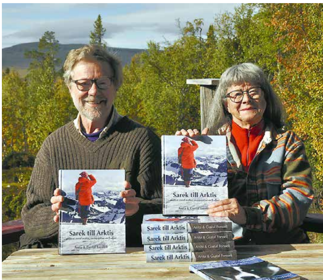
Fotot är från fjällstugan i Härjedalen. Vi gläds åt att också ha samlat våra arktiska berättelser i en bok.