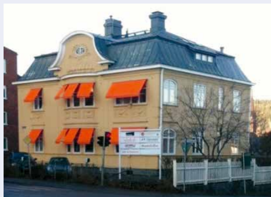
På Thulegatan 24 hyr vi ett mindre kontor Senioruniversitetet i Sundsvall Thulegatan 24 852 36 SUNDSVALL